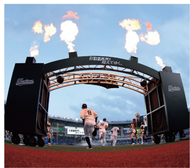
MARINES DOCUMENTARY 自分たちを超えてゆく。2024 PHOTO BOOK