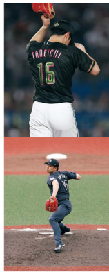
03 ROKI SASAKI